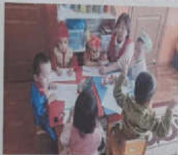
«Ақбота» кіші тобы 29.05.2024ж «Бейбітшілік - ел тірегі»